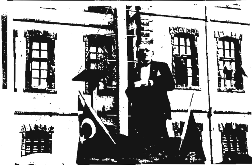
Durak Bey 12 Mart 1934 tarihinde Erzurumun Kurtuluşu Dolayısıyla eski belediye binası önünde konuşma yaparken