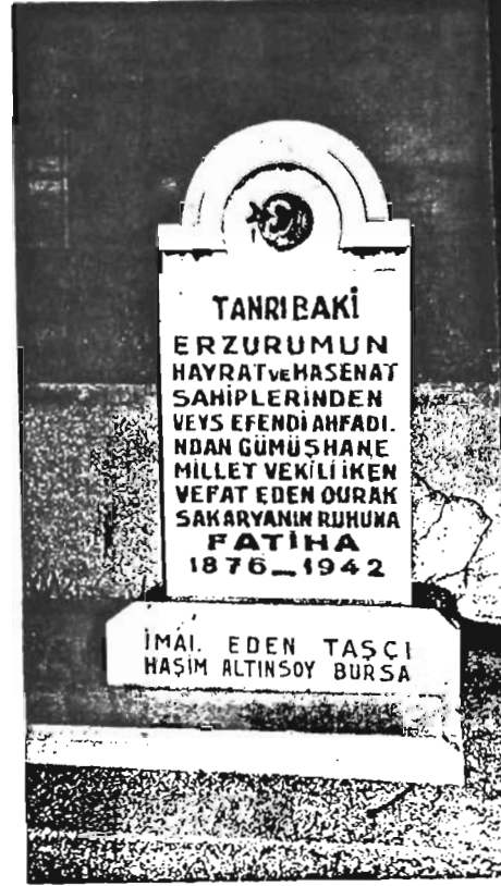
Durak Bey'in Bursa Emir Sultan'da