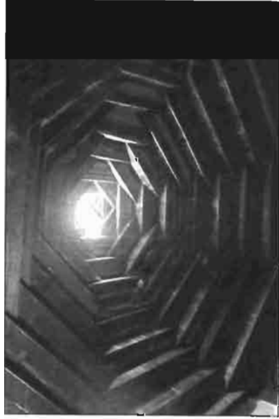
Resim 9. Hanagaşigil Evi Tandırbaşında Kırlangıç Örtü