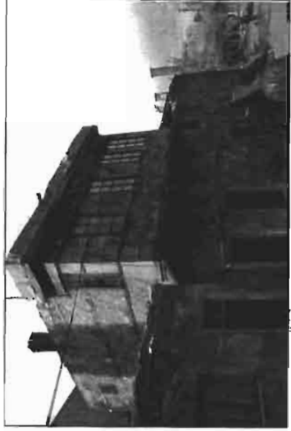
Resim 4. Yaşar İkizler