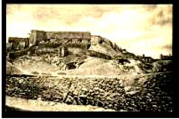
İşgal Yıllarında Erzurum Kalesi