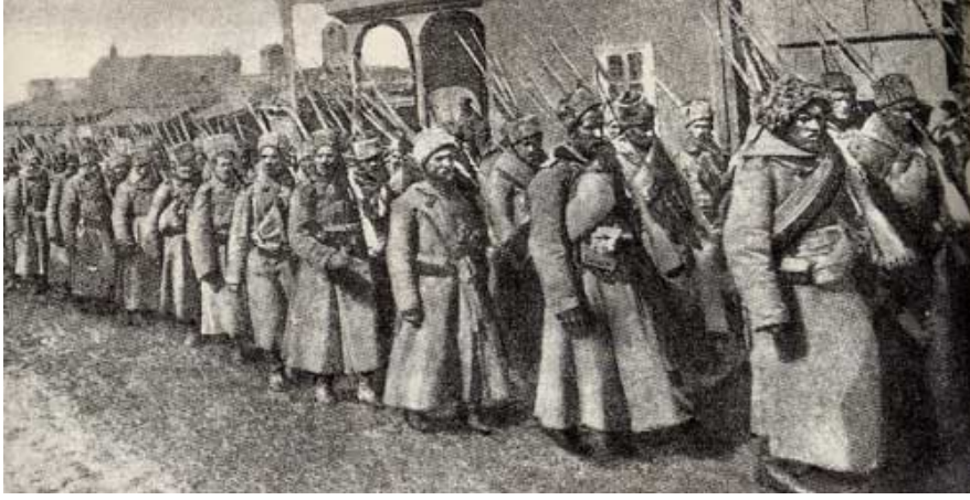
Rus Birlikleri Erzurum'a Girerken

Sonuç olarak belirtmelidir ki, işgalin ilk günlerinde başta Erzurum halkının yaşadığı sıkıntılar ve Rus Hükümetinin politikaları olmak üzere işgalin ilk günlerinden itibaren yapılan ve Erzurum'un bir Türk yurdu olarak kalmasında şüphesiz büyük önemi olan yardım faaliyetleri de Erzurum tarihi incelenirken göz ardı edilmemesi gereken önemli hususlardır.